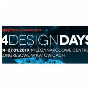
Proform zaprasza na targi 4 DESIGN DAYS