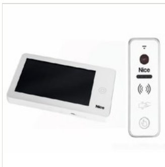
Zestaw wideodomofonowy – Pro WPlus

którym użytkownik nigdy nie rozstaje się. Niedawno rozszerzyliśmy także ofertę pilotów dedykowanych do rozwiązań osłonowych i jako absolutny hit należy wskazać tutaj pilot Era P View, który stanowi małe centrum zarządzania całą automatyką domową wykorzystującą drogę radiową Flor."